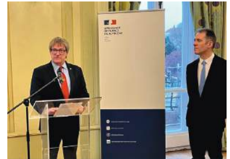
Rede des LGO Güttner in der franz. Botschaft

österreichische Küche. Aber wohl zum beeindruckendsten Programmpunkt kann wohl der Empfang in der französischen Botschaft gezählt werden. Die Delegationen der IPA-Wien und der IPA-Paris wurden durch das historische Gebäude und dessen Geschichte geführt. Anschließend erfolgte der Empfang durch den französischen Botschafter Matthieu Peyraud. In bewegenden Ansprachen in französischer und deutscher Sprache, wurde die internationale Verbundenheit und Freundschaft der Polizeibeamten der beiden Städte besonders hervorgehoben und gewürdigt.