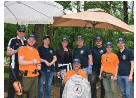
Bogenschießen der IPA-Wien

(Wild) in einem Waldstück mit Pfeil und Bogen zu beschließen. Obwohl der Spaß und das Kennenlernen im Vordergrund standen, führte die Punkte-zählung natürlich zu einer Reihung, welche für die IPA-Wien sehr erfreulich ausfiel. Zusammengefasst: Ein großartiges Erlebnis, Spaß und ein Brückenschlag der IPA-Wien nach außen hin! Vielen lieben Dank Andy!!