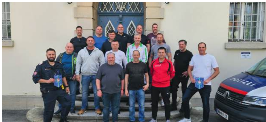
198. E2a GAL vor dem PAZ